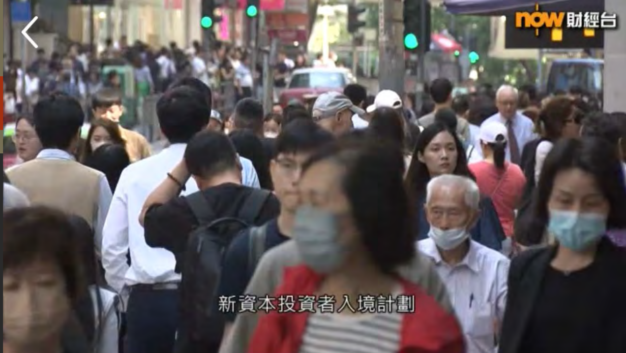
新資本投資者入境計劃